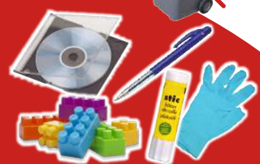
Objets en plastique, jouets