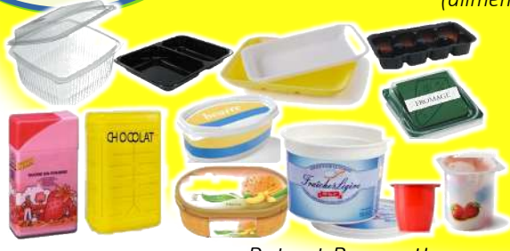
Pots et Barquettes