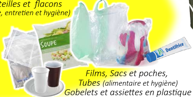
Films, Sacs et poches, Tubes (alimentaire et hygiène) Gobelets et assiettes en plastique