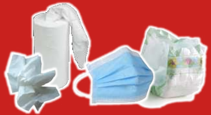
Masques, Essuie-tout, Lingettes Mouchoirs et serviettes en papier, Protections hygiéniques, Couches