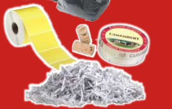
Papier déchiqueté, Photos, Papier peint Bobines, Éléments en bois