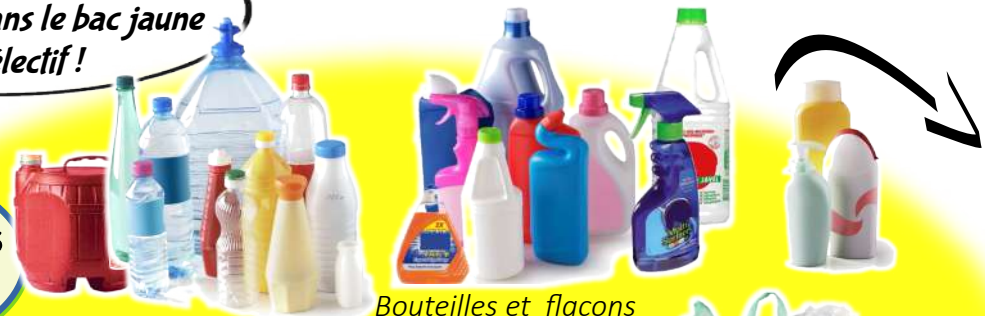
Bouteilles et flacons (alimentaire, entretien et hygiène)