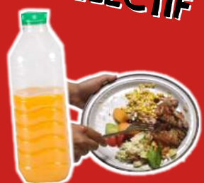
Restes de repas Emballages non vides