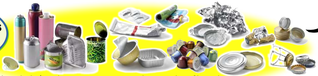
Aérosols, boîtes de conserve, canettes, dosettes de café en aluminium, papier aluminium, opercules, capsules, gourdes compote